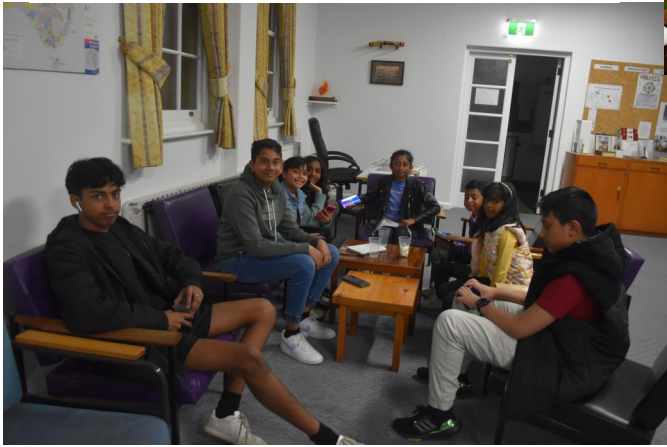
Opportunity for kids to make friends