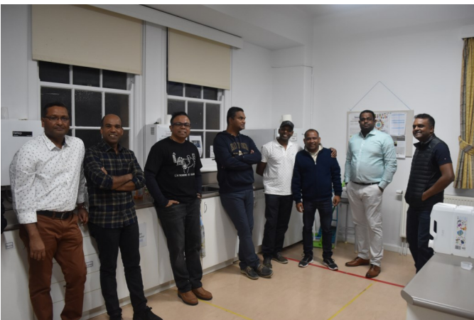
Waiting patiently for the food to arrive is never easy