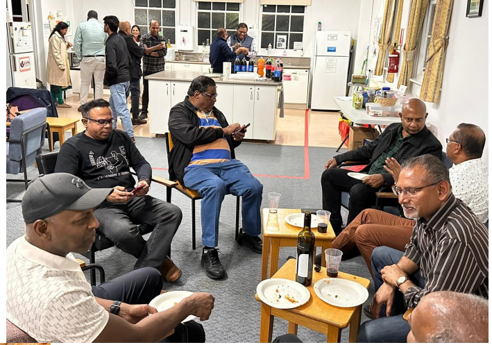
Relaxed and friendly atmosphere