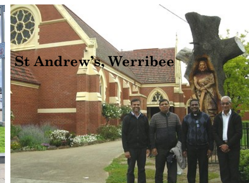
St Andrew's, Werribee