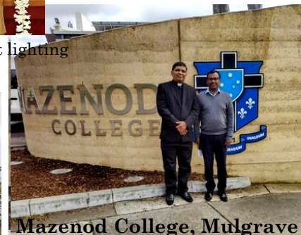
Mazenod College, Mulgrave