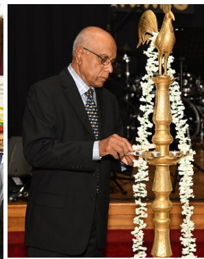
OBA's first president lighting the traditional lamp.