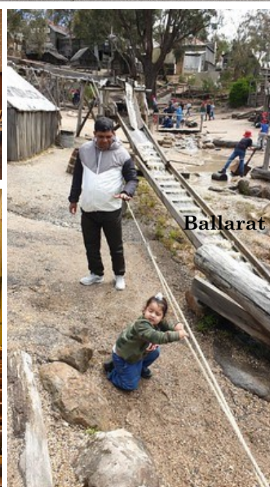
Ballarat Gold Mine