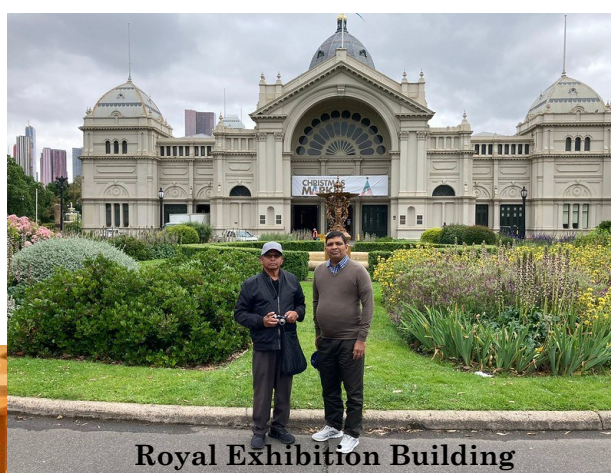
Royal Exhibition Building